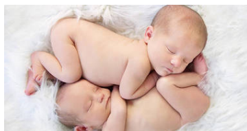
Gemelli abbandonati, i medici del San Giovanni di Dio...