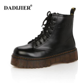
Delle Donne di modo Stivali Autunno...