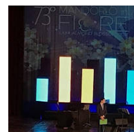
Mandorlo in scenografia di "Agrigento"