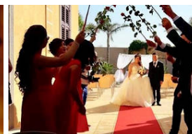
Licata, matrimoni sorpresa: ladri svaligiano casa d