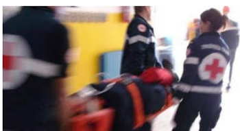
Agrigento, colto da malore: muore mentre è a lavoro