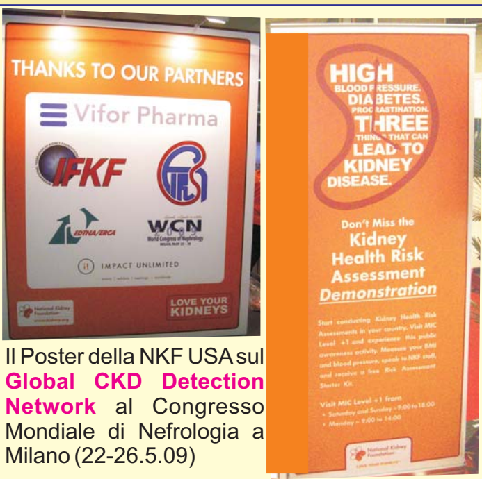
Il Poster della NKF USA sul Global CKD Detection Network al Congresso Mondiale di Nefrologia a Milano (22-26.5.09)

Conoscere i Reni , l'opuscolo tascabile che illustra in forma elementare i reni, come funzionano, quali sono le malattie renali più comuni, quali le terapie (inclusi dialisi e trapianti), come prevenirle, è disponibile per la distribuzione nelle postazioni Camper, nelle Scuole e negli ambulatori, per il gentile contributo di ABBOTT Renal Care. Chi ne volesse copie per distribuirle deve richiederle subito a firandreucci@yahoo.it .